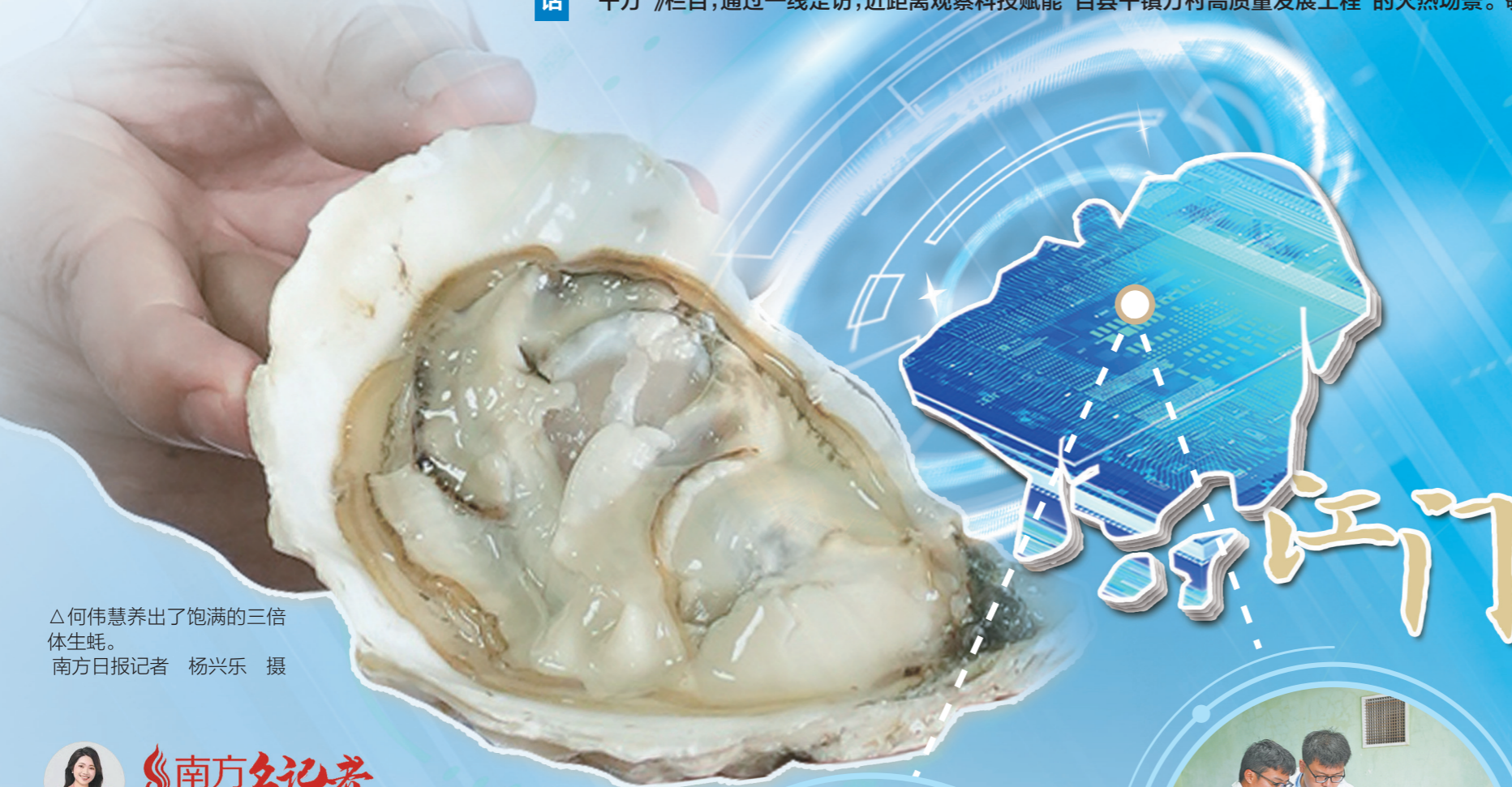
△何伟慧养出了饱满的三倍体生蚝。